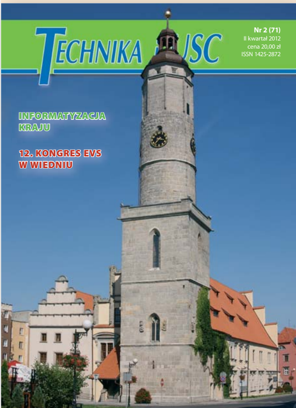
Na 1. str. okładki - Siedziba USC w Lwówku Śląskim