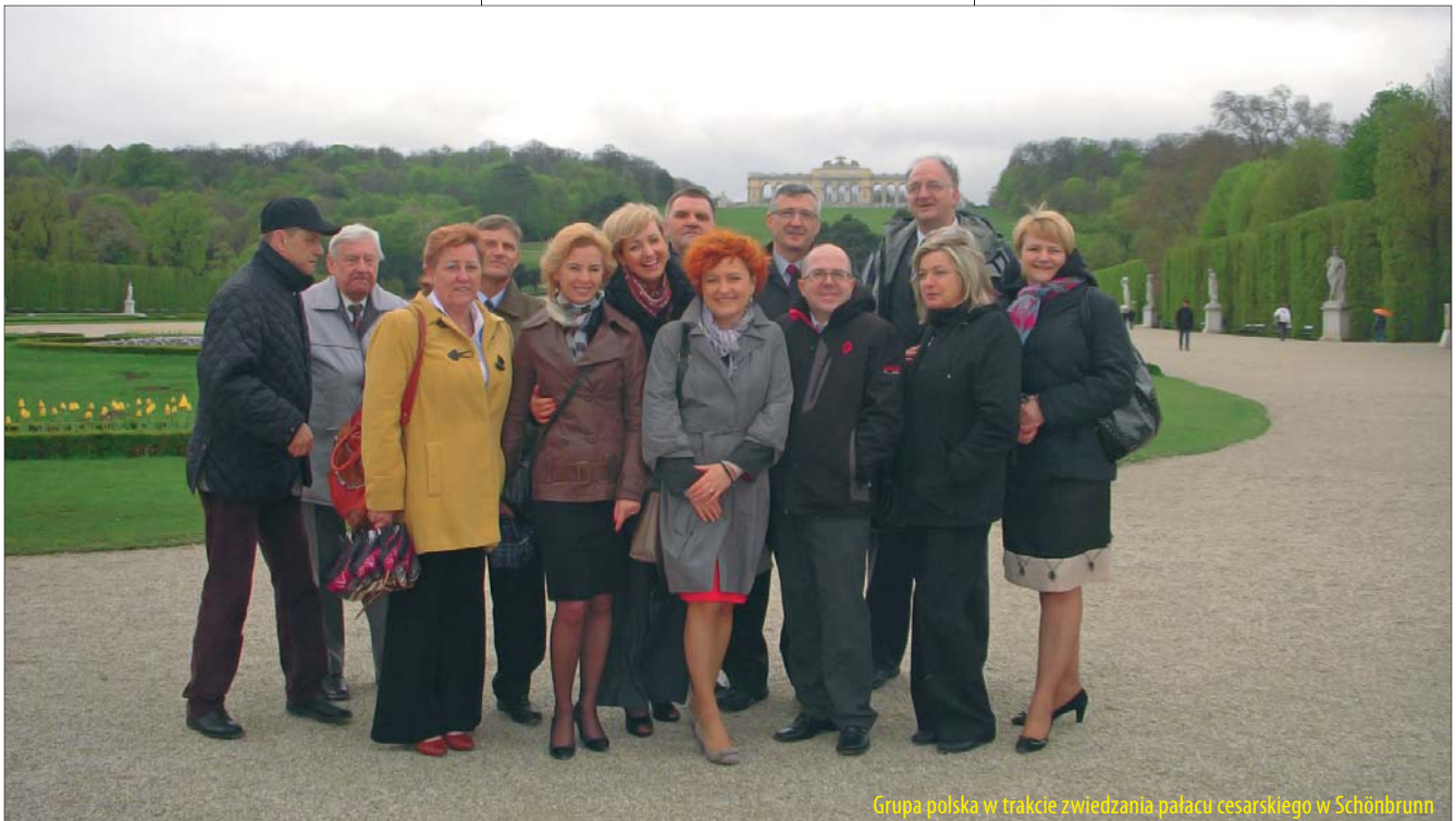
Grupa polska w trakcie zwiedzania pałacu cesarskiego w Schönbrunn