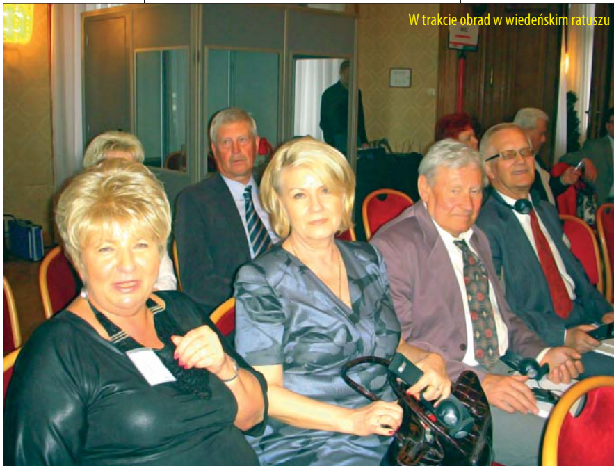
W trakcie obrad w wiedeńskim ratuszu

Na zakończenie dnia uczestnicy Kongresu zostali zaproszeni przez burmistrza Wiednia na uroczystą kolację do