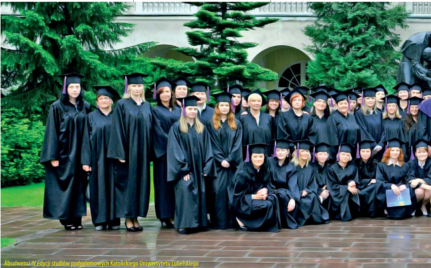
Absolwenci IV edycji studiów podyplomowych Katolickiego Uniwersytetu Lubelskiego

Do egzaminu końcowego IV edycji przystąpiło 75 studentów w dwóch