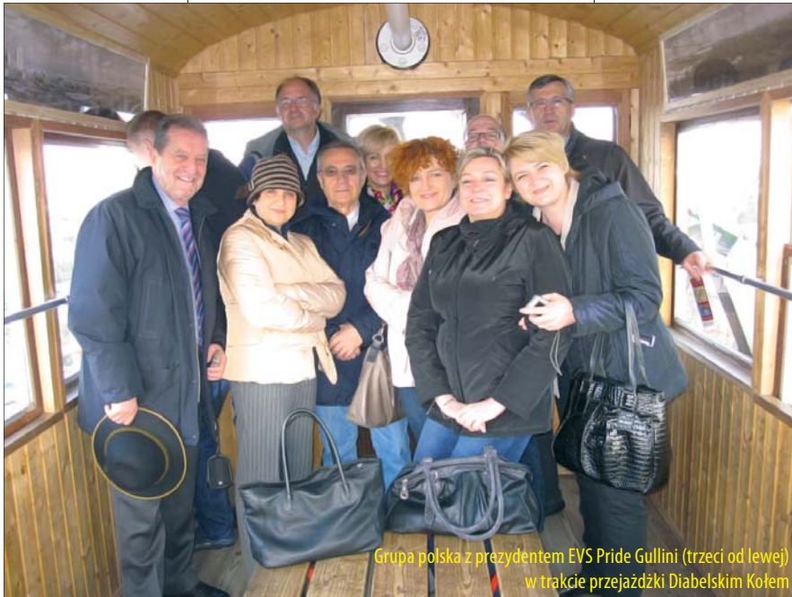
Grupa polska z prezydentem EVS Pride Gullini (trzeci od lewej) w trakcie przejażdżki Diabelskim Kołem

W drugiej części obrad odbyły się równoległe warsztaty dotyczące trzech tematów: prawa